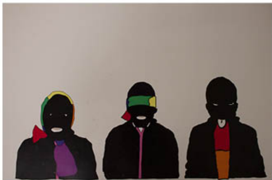
ALEXANDRA SIERRA (Puerto Rico) Anónimos en la lucha, anónimos en la brega / Anonymous in the struggle, anonymous in the fight, 2012 Digital impression or digital drawing, 62 ½" x 98 ¾" (12 ½" x 19 ¾" ea.)